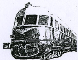
La vecchia littorina della linea Mantova Peschiera

“Importante per il turismo e per diminuire il traffico automobilistico sulle strade”